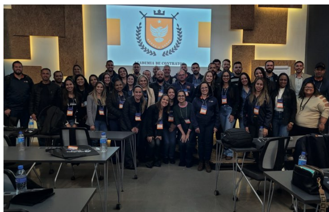
> Liderança do Grupo Avante participa de treinamento