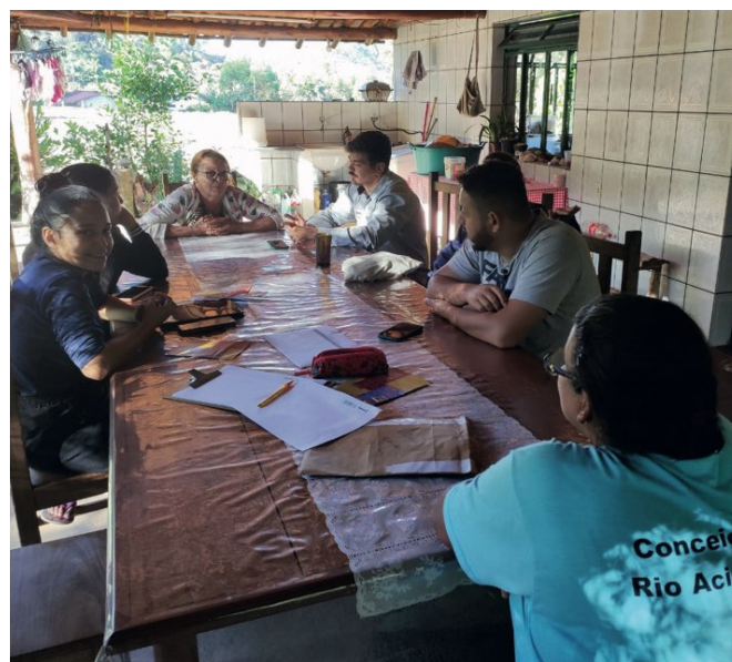
> Produtores locais participam de capacitação da Rota Jaguarua

A nossa colaboração solidifica a união entre as comunidades e ressalta a beleza e o potencial turístico da região. Ao compartilharmos conhecimentos e trabalharmos em conjunto, estamos construindo um futuro mais próspero e promissor para a Rota Jaguarua.