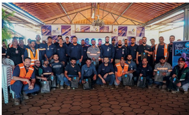
> Colaboradores participam de ação do Dia dos Pais