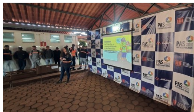
> Colaboradores participam das ações da Semana de conscientização