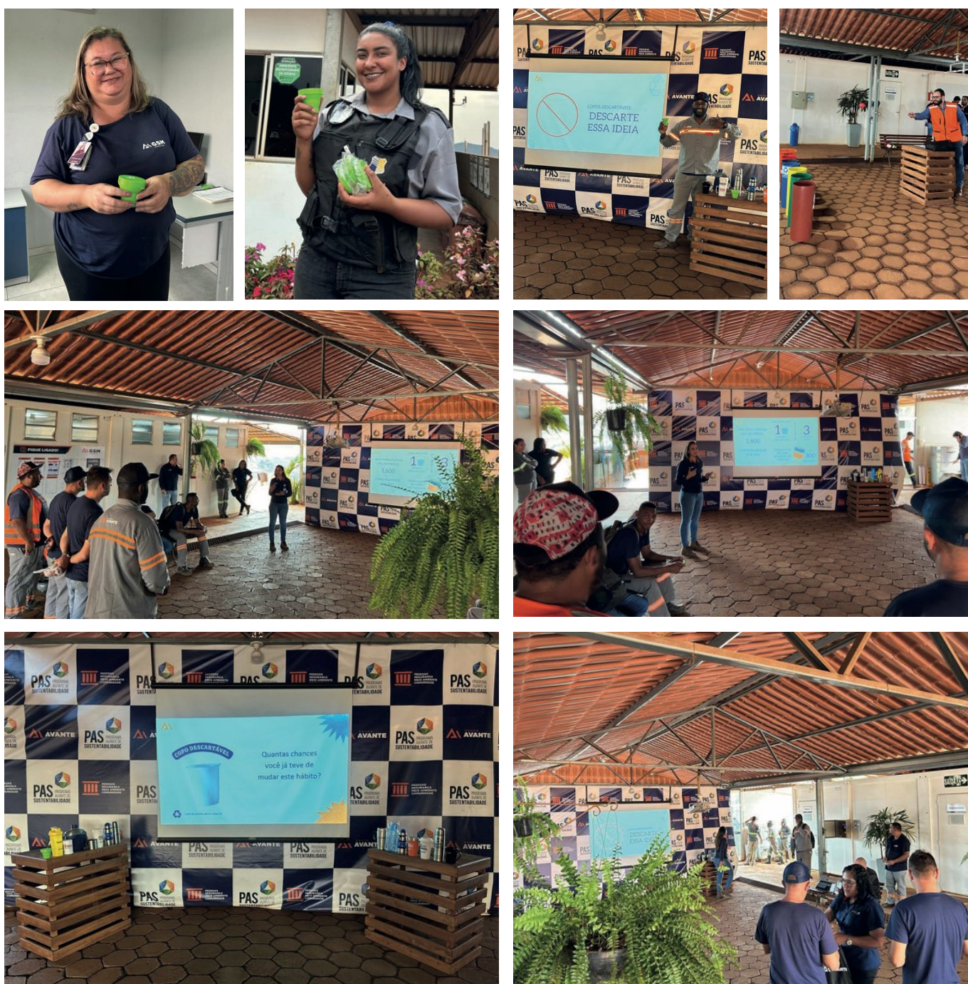
> Colaboradores participam de ações de conscientização

Para tornar essa ação ainda mais interativa e prática, realizamos dinâmicas de conscientização em todas as nossas unidades. Além disso, como forma de engajar nossas equipes, entregamos para cada colaborador com um copo retrátil, incentivando o uso consciente e sustentável em seu dia a dia.