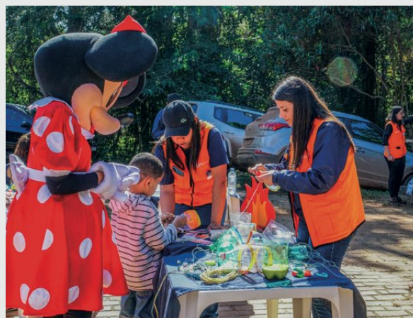
> Voluntários Avante participam de oficina

um capítulo inaugural de muitos que virão. Estamos comprometidos em criar um impacto positivo duradouro, alinhando nossas ações com os valores de solidariedade e empatia que guiam o Grupo Avante. Juntos, estamos construindo um amanhã melhor para todos.