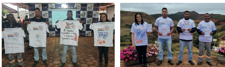
> Colaboradores participam em ações da data