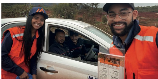
> Colaboradores em Blitz Informativa para as comunidades