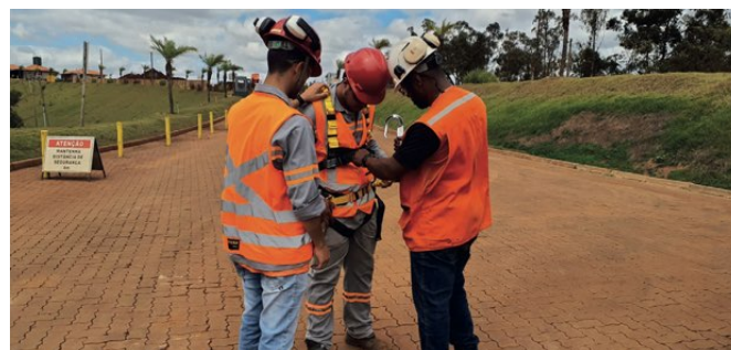
> Colaboradotres participam das ações da Semana de Conscientização

Esta iniciativa fez parte das atividades da Semana Nacional do Trânsito em nossas unidades, reforçando nosso compromisso com a segurança e a capacitação de nossos colaboradores