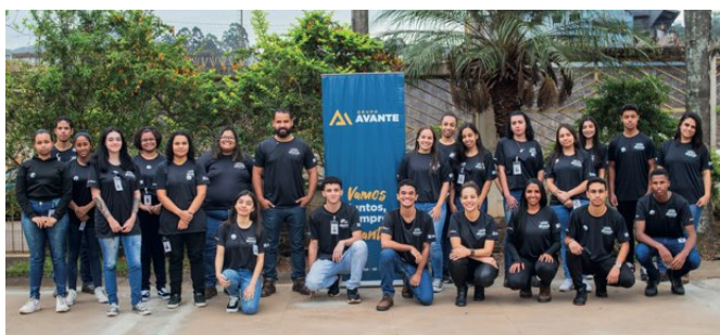
> Equipe GSM e jovens aprendizes durante aula inaugural

A parceria do Grupo Avante com o SENAI fortalece o nosso compromisso com a educação e o desenvolvimento sustentável das comunidades na nossa área de influência.