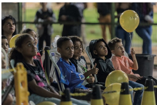
> Festival de Literatura e Cinema leva cultura e lazer para a comunidade