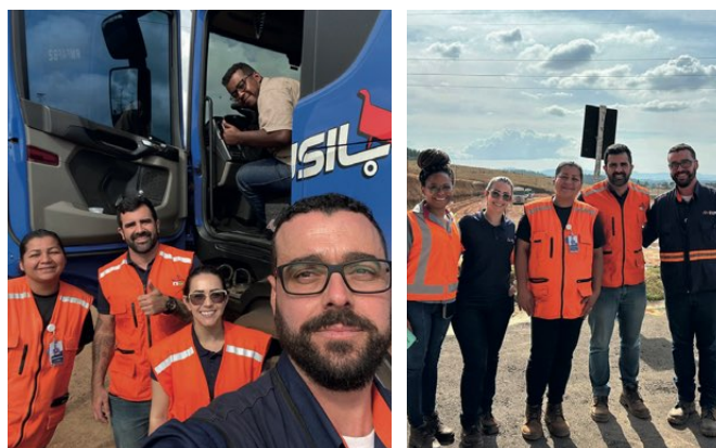
> Setores se unem em ação de segurança e responsabilidade ambiental

Durante a inspeção, foram verificadas a documentação dos veículos, instalação de inclinômetro, lona fácil, polietileno, utilização do kit ambiental, condição de pneus e uso de EPIs. Também foi realizada uma avaliação de conhecimentos com os motoristas sobre as regras de segurança do pátio. Essa é uma prática muito importante para garantir a segurança nas estradas e vias internas, bem como para proteger o meio ambiente e manter a integridade dos veículos.