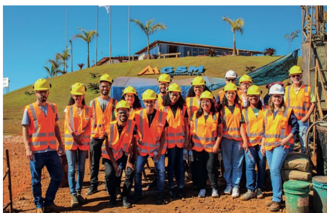
> Universitários conhecem processo produtivo da GSM, em Barão de Cocais