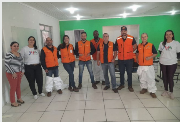
> Ação voluntária de colaboradores na ONG Juventude e Viração