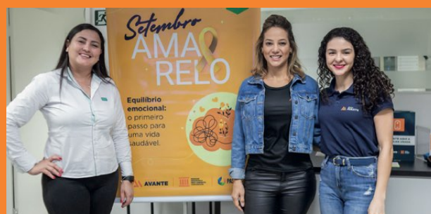
> Colabores participam de conversas sobre o Setembro Amarelo