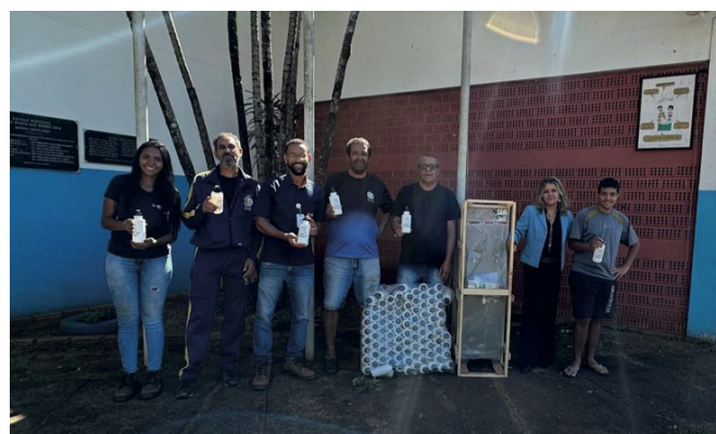
> Equipe socioambiental realiza entrega de doação para a Associação Novo Rumo

A Associação Novo Rumo, que atende comunidades como Santa Cruz, São Benedito, São João Batista, Santo Antônio, Lagoa e outros bairros de Barão de Cocais, está empenhada em criar oportunidades transformadoras, com atividades esportivas, culturais, de lazer e educação. A doação dos itens contribuiu com a hidratação dos jovens durante os treinos esportivos.