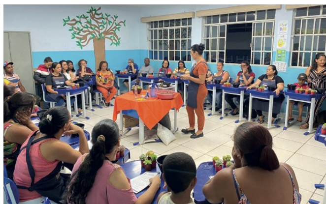
> Comunidade participa da Oficina de Suculentas

No dia 20 de setembro de 2023, realizamos uma Oficina de Suculentas em comemoração ao Dia da Árvore. Contamos com a presença de 28 moradores das comunidades dos Bairros Santa Cruz e São Vicente. Nossa missão? Transformar o dia de todos! A Oficina foi uma verdadeira imersão pelo mundo das suculentas, um convite para aprender sobre o plantio, o cuidado e o carinho que cada muda merece. Mas não foi só isso! Foi também uma oportunidade de unir nossa comunidade, fortalecendo laços. Juntos, cultivamos não apenas plantas, mas também o sentimento de pertencimento e a certeza de que o crescimento acontece quando estamos unidos.