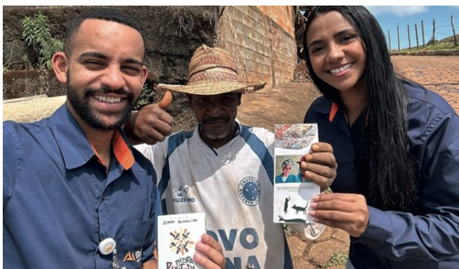
> Colaboradores participam da ação com moradores

Nos dias 23 e 30 de agosto, realizamos uma ação porta a porta nas comunidades Córrego da Onça e Santa Cruz, com foco no tema 'Educação Patrimônio Cultural'. Durante essa iniciativa, destacamos a importância da valorização e preservação do nosso patrimônio cultural. Também informamos sobre a reabertura de um dos mais significativos pontos turísticos da região e um dos sítios históricos mais relevantes do país: o Sítio Arqueológico da Pedra Pintada, localizado em Cocais. Essa ação visa não apenas educar, mas também inspirar a comunidade a apreciar e proteger nossa rica herança cultural. Estamos comprometidos em fortalecer nossa conexão com o passado para um futuro mais sustentável e consciente.