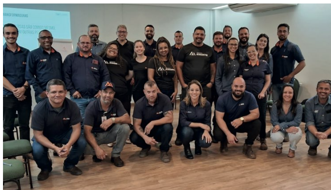
> Colaboradores participam de treinamento

O PDL tem por objetivo impulsionar o protagonismo dos líderes Avante, trazendo ainda mais conhecimento sobre o papel da liderança no negócio e na gestão de pessoas.