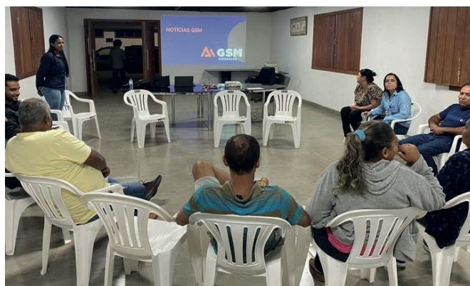
> Empresa e comunidade se reúnem para o FAS

Outros apontamentos realizados nos encontros referiram-se ao status do plano diretor (em revisão) e aos desdobramentos da reunião ocorrida na comunidade para tratativa desse tema. Além disso, foram repassados informes sobre o início das aulas no Projeto Atletas do Futuro e Programa Jovem Aprendiz e realização do convite para o Felici (Festival de Cinema e Literatura), realizado ainda em agosto.