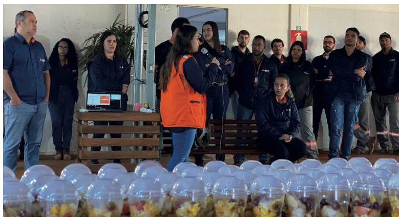
> Colaboradores participam de campanha do Dia Nacional da Saúde