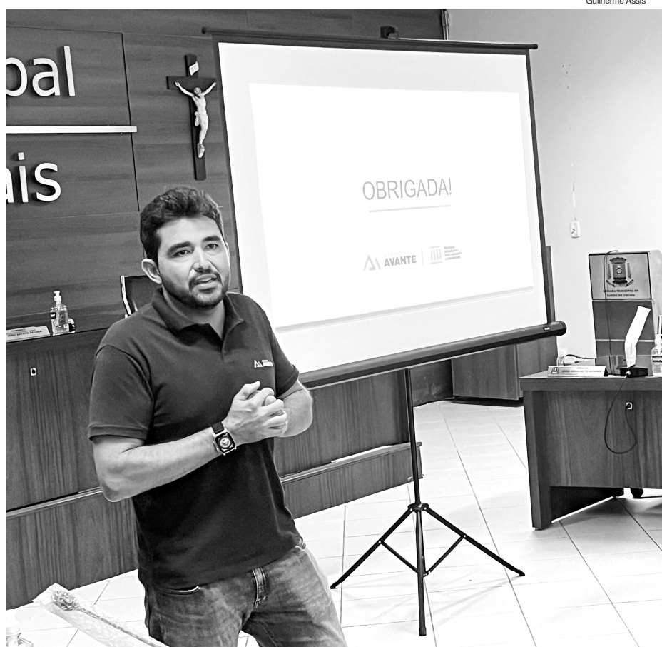
Projeto da ferrovia foi apresentado pela GSM aos vereadores, na Câmara

destacou que a construção do ramal ferroviário reduzirá o volume de caminhões circulando nas comunidades de Córrego da Onça e Brumal. “Nosso esforço é diminuir ao máximo o número de caminhões em circulação”, explicou.