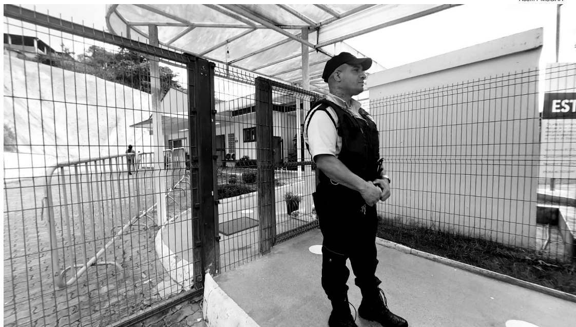
Prefeitura de São Gonçalo reforçou a segurança em todas as escolas da rede municipal