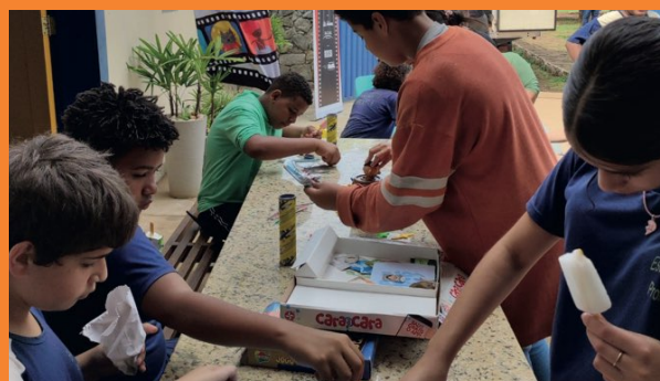
> Na comunidade de Brumal, a Escola Municipal Cecília Alves Duarte foi contemplada com uma proposta literária, por meio do projeto incentivado FELICI (Festival de Literatura e Cinema, reforçando o compromisso da GSM Mineração com a Cultura e a Educação. Promovemos momentos com leitura, oficinas e cinema para despertar o interesse das crianças. A ação realizada no ambiente escolar, fortalece o nosso compromisso com as ODS de número 4 da ONU - educação de qualidade. A ação ocorreu no turno da manhã (contemplando 185 alunos) e tarde (contemplando 110 alunos). Durante o evento foram dispostas guloseimas (pipoca, algodão doce e picolés) às crianças que participaram do evento.