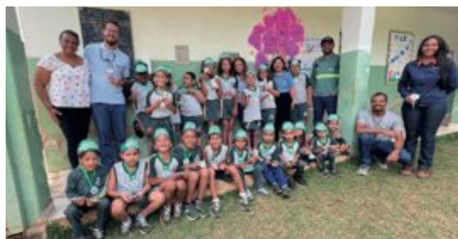
> Ações com a comunidade inspiradas no Dia da Árvore

Juntos, fizemos o plantio de mudas de árvores no entorno da Escola Municipal José Maria dos Mares Guia, em Barão de Cocais, cumprindo com o compromisso de cultivar um futuro mais verde e sustentável para todos.