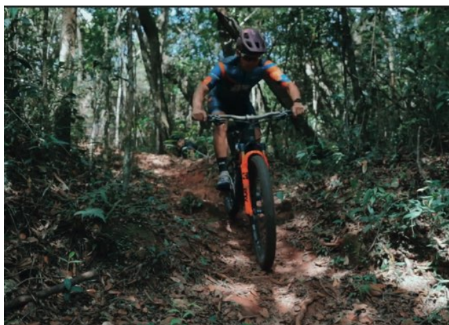
> O projeto visa contribuir para o impulsionamento da economia local