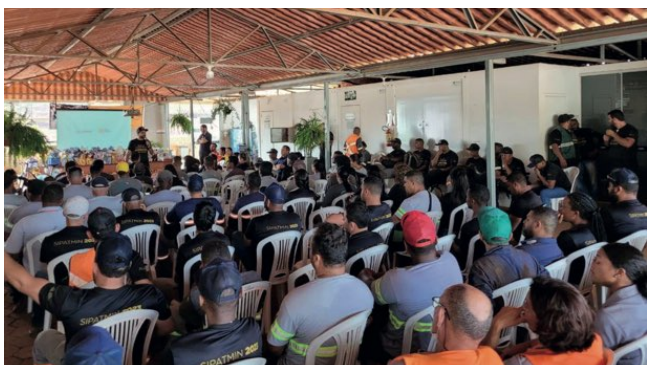
> Colaboradores participam da SIPATMIN