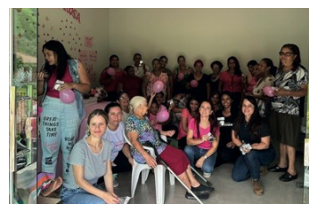
> Colaboradores se unem na essencial campanha do Outubro Rosa