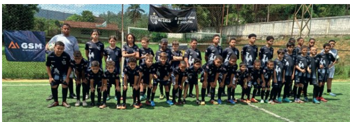
> Uniformes são entregues para os alunos