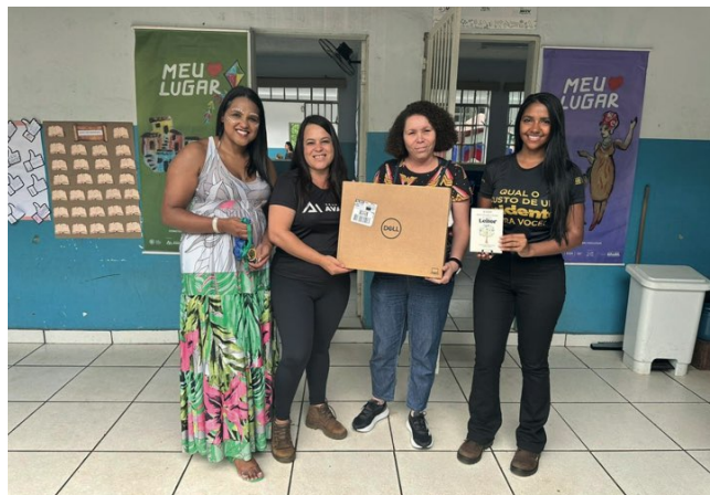
> Escola recebe doação de notebook da GSM Mineração

Este compromisso reforça o Programa Avante de Sustentabilidade, destacando a importância de garantir o acesso à educação inclusiva, de qualidade e equitativa para todos.