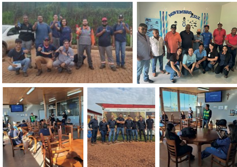
> Novembro azul movimentou colaboradores no Grupo Avante

Uma vez que é sempre muito importante podermos nos lembrar do autocuidado fazendo exames preventivos e entender a enorme importância do diagnóstico precoce do câncer de próstata, que possibilita, segundo apontamento de diversos profissionais da saúde, 90% de chance de cura.