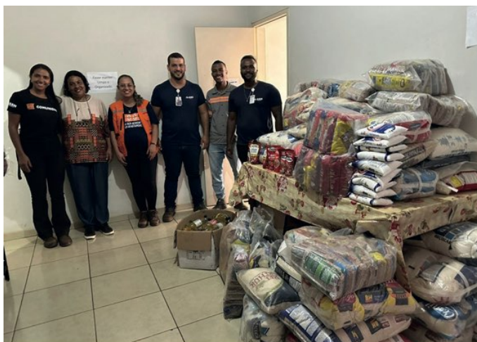
> Entrega de doações arrecadadas durante SIPATMIN