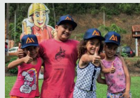
> Comemoração do Dia das Crianças em Barão de Cocais