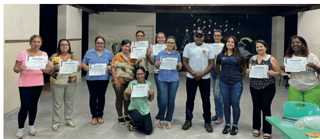
> Comunidades participam de treinamentos