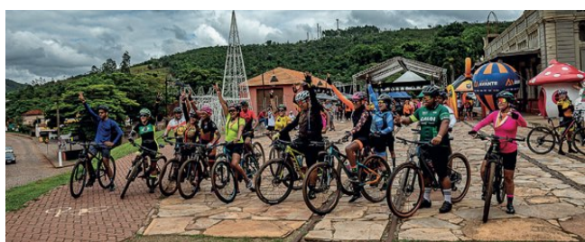
> GSM marca presença no evento

O projeto tem a missão de contribuir para a saúde física e mental dos participantes, promovendo o desenvolvimento contínuo do esporte e da cultura locais. A GSM Mineração se orgulha de apoiar iniciativas que beneficiam a comunidade e incentivam a prática esportiva.