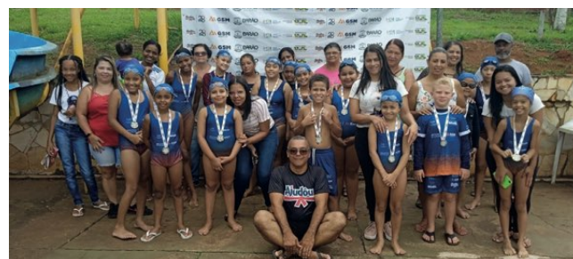
> Atletas do Futuro participam de festival

O evento, promovido pelo Ajudô, contou com o patrocínio da GSM Mineração por meio da Lei Federal de Incentivo ao Esporte e o apoio da Prefeitura Municipal de Barão de Cocais. Vale destacar que as aulas do Projeto Atletas do Futuro são oferecidas de forma gratuita para todos os alunos, contribuindo para o desenvolvimento esportivo e social na comunidade.