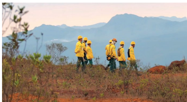
> Brigada APAS em ação

A Brigada ainda desenvolve ações de educação ambiental em sua área de atuação. É importante reforçar que esse projeto contribui para o fortalecimento da Agenda 2030 e com os Objetivos de Desenvolvimento Sustentável da ONU.