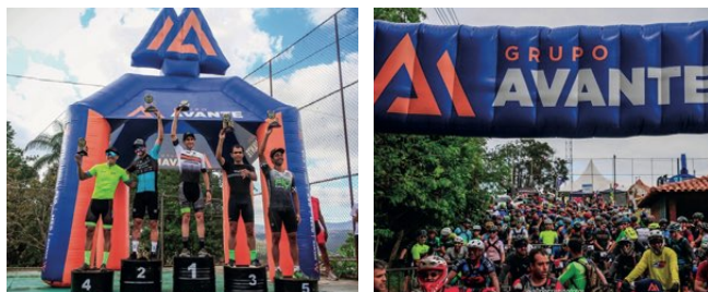
> Mais de 300 atletas participaram da prova

O Desafio Avante Entre Serras 2023 foi realizado em três etapas históricas; em Catas Altas, Acuruí e Cocais, proporcionando uma injeção financeira de mais de 150 mil reais nos municípios sedes do evento. O Grupo Avante se orgulha de contribuir para o desenvolvimento das comunidades, apoiando eventos que promovem esporte, lazer e impulsionam a economia local.