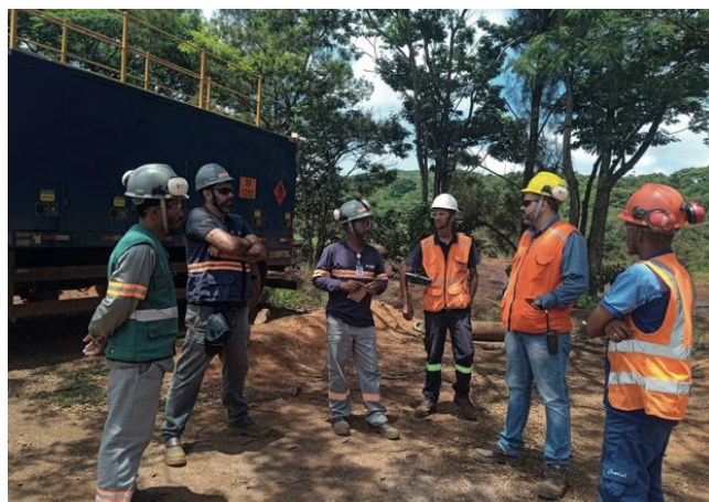
> Ação da blitz educativa

No total, 104 pessoas foram abordadas, 72 equipamentos vistoriados e 17 cartões de Olhar Seguro abertos, que ajudaram a identificar 113 não conformidades as quais geraram 13 interdições para adequações e a emissão de 5 notificações. Como resultado, a ação contribuiu para reforçar a importância que a segurança tem para as pessoas, tanto no uso de EPIs como para as condições de veículos e equipamentos que hoje são utilizados.