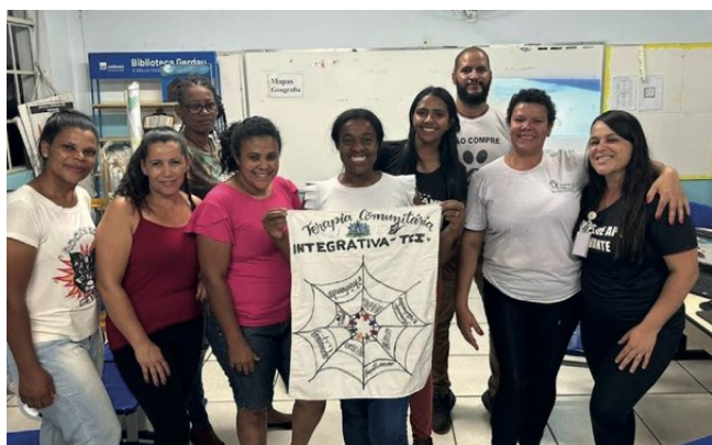
> Dinâmica realizada na RCC de Santa Cruz

Continuamos unidos, construindo juntos com a comunidade um ambiente de apoio e resiliência.