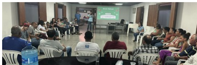
> Membros do FAS realizam a última reunião do ano

Projeto fundamental para garantir que as atividades das mineradoras estejam em harmonia com o desenvolvimento sustentável da região e com o bem-estar da população local. O Fórum de Acompanhamento Socioambiental acontece mensalmente e visa promover a transparência nas comunidades, em consonância com os princípios do pilar Comunidade do Grupo Avante.