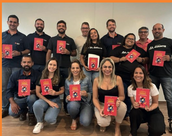
> Colaboradores concluem o PDL 2023

Todos os módulos, além de fornecer diversos aprendizados e ferramentas para o aprimoramento profissional, também seguem alinhados com nossos 4 pilares e o jeito Avante de ser. Seguimos juntos, sempre Avante!