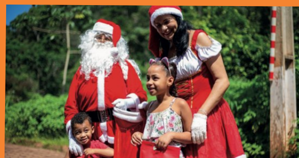
> A magia do Natal chega às crianças das comunidades