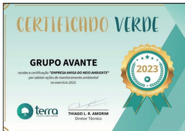
> Grupo Avante recebe certificado de meio ambiente

Nosso propósito vai ao encontro de uma exploração mineral sustentável, contribuindo de forma positiva para o desenvolvimento social e econômico das regiões onde exercemos nossas atividades. Agradecemos à Terra Consultoria e Análises Ambientais por este reconhecimento, que impulsiona nosso compromisso contínuo com práticas ambientais responsáveis. Juntos, construímos um futuro mais sustentável e harmonioso.