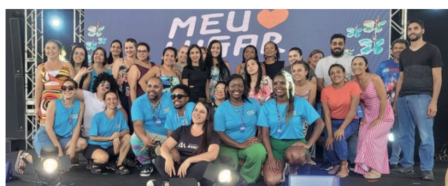
> Crianças participantes fazem apresentação

Nos dias 18 e 21 de outubro, ocorreu o encerramento do projeto Somos Comunidade-Meu lugar, nas comunidades Leão XIII, Santa Cruz e São Vicente. Para o encerramento, foi realizada uma apresentação do resultado das oficinas culturais desenvolvidas com as crianças e adolescentes da comunidade.