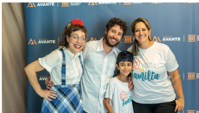
> Visita da Família na Matriz, em Nova Lima

A última edição da Visita da Família 2023 foi um sucesso!