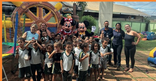
> No distrito de Cocais, a celebração contemplou 94 crianças da Escola Municipal Casinha Feliz. A GSM Mineração proporcionou um dia de brincadeiras e guloseimas para as crianças do maternal matriculadas na instituição.

Comemoração do Dia das Crianças em Barão de Cocais. Em comemoração ao Dia das Crianças, proporcionamos, nas comunidades do entorno da GSM Mineração, um dia repleto de alegria e diversão. A iniciativa incluiu diversas atividades, brincadeiras e guloseimas, como picolés e brigadeiros, que garantiram a festa da garotada.