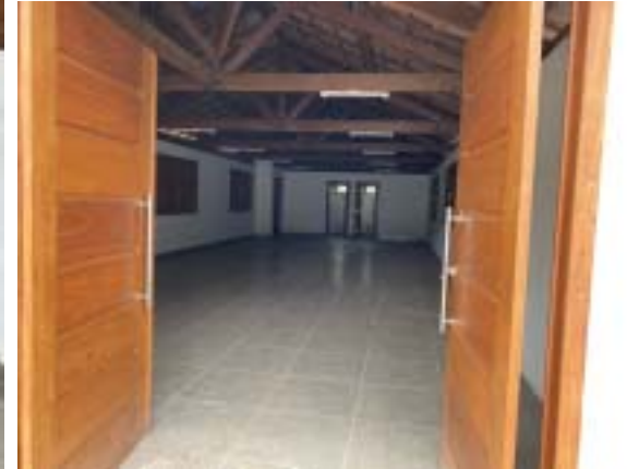
Qualidade do acabamento do centro comunitário construído pela GSM impressiona, principalmente pelo uso de madeiras maciças nas portas e janelas