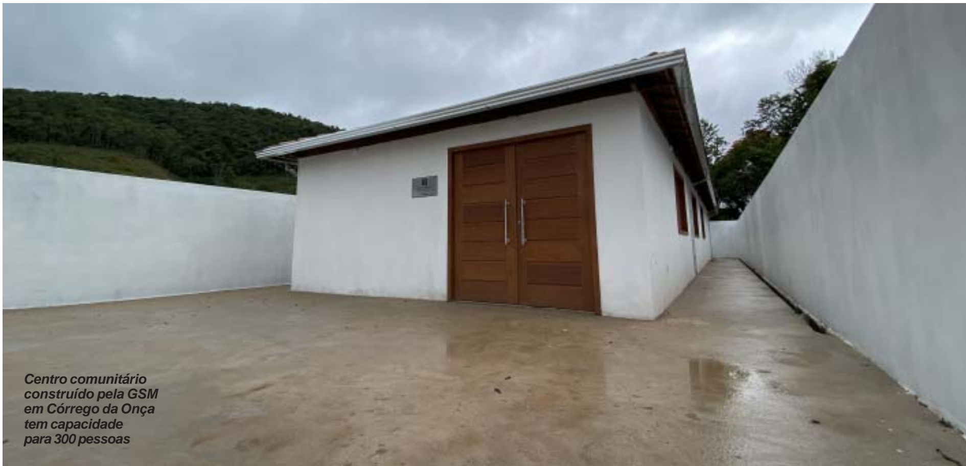
Centro comunitário construído pela GSM em Córrego da Onça tem capacidade para 300 pessoas